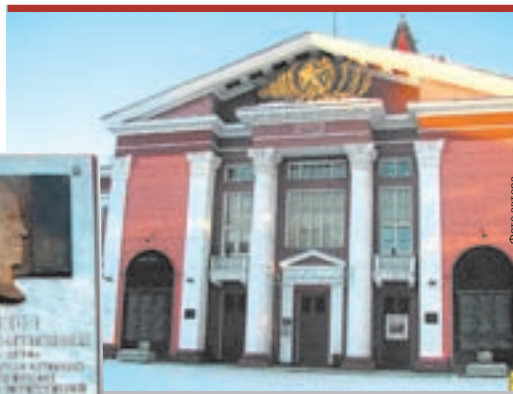
Мемориальная доска Г. Жукова на фасаде Пермского дома офицеров

— Когда Жуков приехал в Пермь, навел шороху. Генералов ставил по стойке «смирно». Стал проводить бесконечные учения и проверки. Со 2 мая по 2 ноября 1951 года решил провести масш-