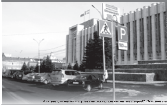
Как распространить удачный эксперимент на весь город? Нет ответа

И. Соларева сообщила, что упавшие доходы вызваны объективными причинами. Так, в краевую казну вернули неосвоенные средства в размере более 600 млн руб. — деньги на обеспечение жильем молодых семей, детей-сирот, модернизацию здравоохранения. Она объяснила неиспользование средств поздним поступлением денег из федерального бюджета. «Субсидии на жилье, например, поступили во второй половине 2011 года, некоторые вообще в декабре. То, что не успели освоить до 31 января, мы обязаны вернуть. Но деньги никому не пропали, мы будем снова их запрашивать в текущем году», — пообещала Соларева.