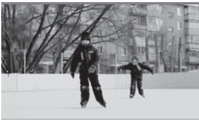
Первоклассники катаются за 100 руб. в час. Дорогое удовольствие!

Лишь чиновников-бизнесменов одного куска, они найдут другой. На ул. Леонова каток хотели забрать под стоянку. Не получив, тогда он стал платным — 100 руб. в час.