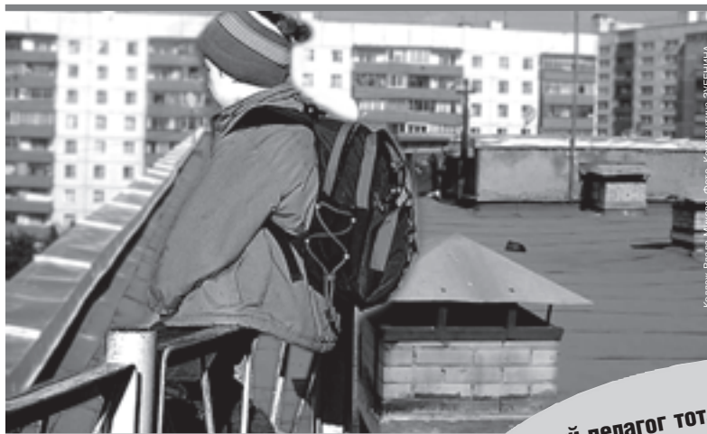
Коллаж: Влада Микава. Фото: Константин Зубенин

— В Пермском крае в 2008 году произошло 40 детских и подростковых суицидов, в 2010-м —