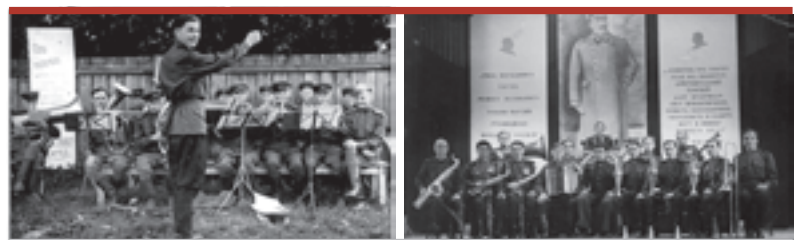
Первый оркестр Владимира Лицмана, Прага, 1945 г. Оркестр пермского гарнизона, 1951 г.