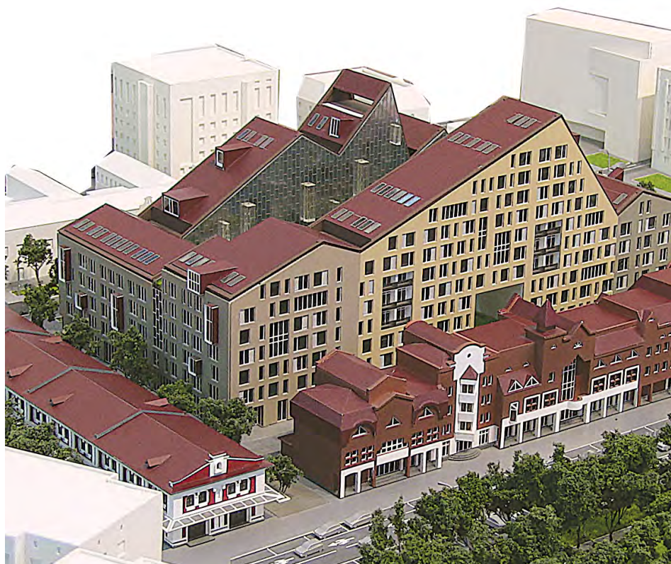
Проект нового жилого комплекса в центре Перми уже почти воплощен в жизнь