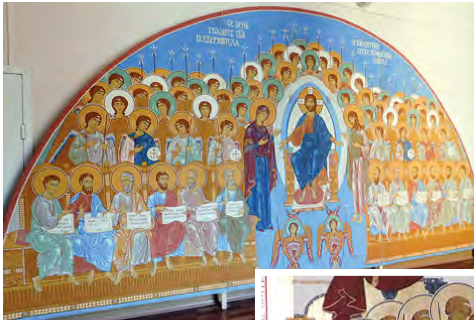
на то, что церковная живопись не каждому по плечу, это особый стиль жизни, ее нужно пропустить через сердце.

— Огромные полотна создают ощущение храма. Показать свои работы здесь — большая ответственность, а увидеть их — большая радость, потому что выставка дает надежду на возвращение иконописи, возрождение строгановской школы, несмотря