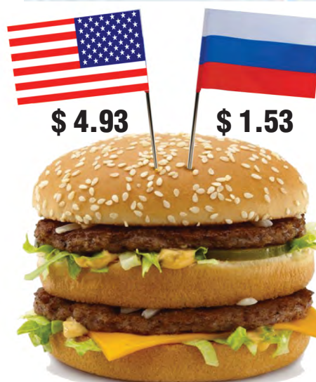
Индекс Биг Мака (валюты: недооцененные (-), переоцененные (+), %)

куска хлеба и копченой колбасы. Одно время «Комсомолка» рассчитывала количество закуски, которую можно купить на одну полочку в разных областях, выявляя, таким образом, самые богатые регионы.