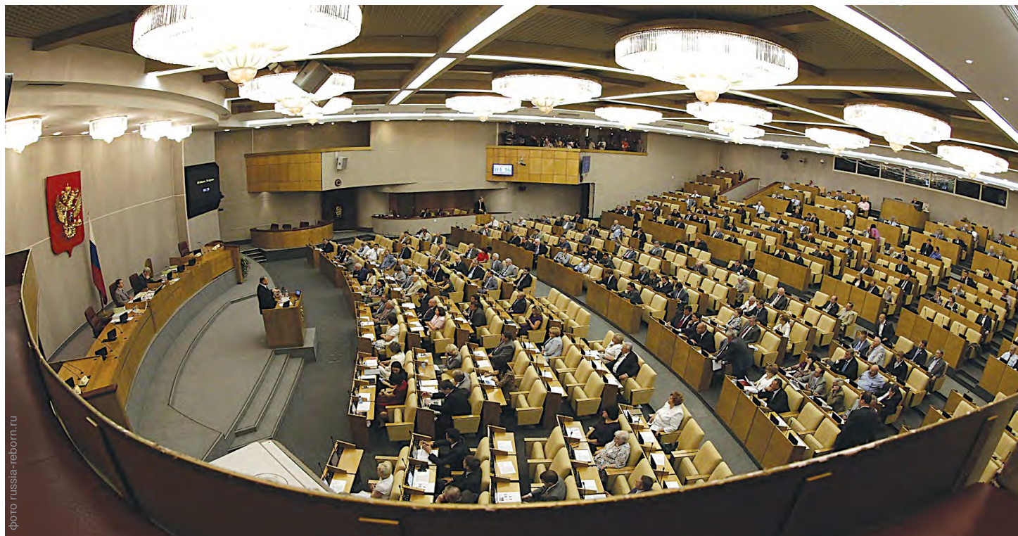
Скрытые предвыборные процессы далеко не так спокойны, как их внешняя сторона

Свои силы на думском поприще собрал попытать и сенатор от Пермского