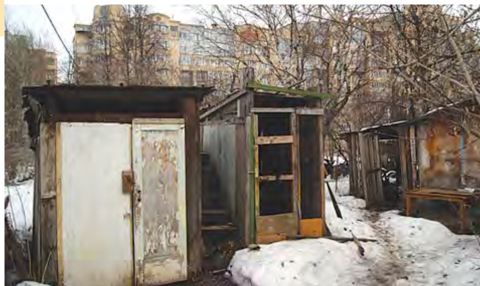
Удобства на улице, оказалось, не самый неудобный момент проживания в «Мертвом квадрате»

— Мы продолжим работу по поиску инвесторов, но, конечно, сложно сказать, в какой срок мы сможем эту проблему