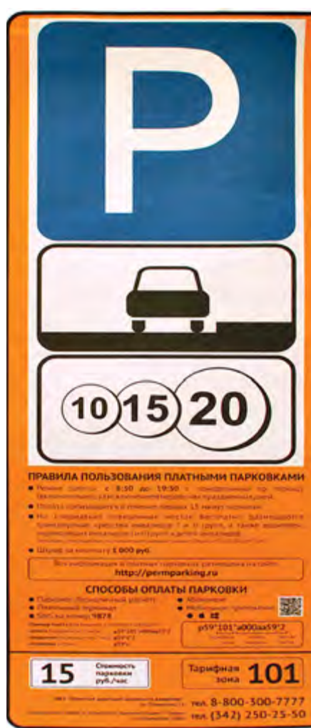
Знаки платных парковок уже появляются на улицах Перми

ность найти парковочное место неподалеку от той точки, куда им нужно попасть. А сотрудники компаний, приезжающие в центр на целый день, могут и должны найти место для своего автомобиля за пределами периметра платной парковки, либо на внеуличной стоянке.