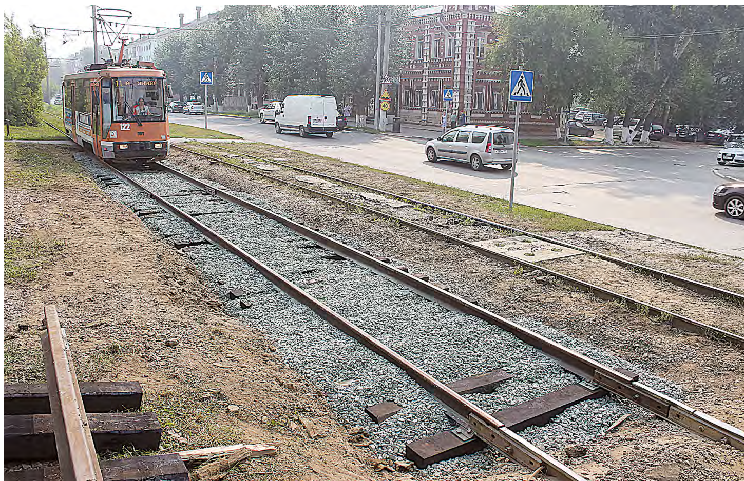
Ремонт идет по всем направлениям: и в длину, и в ширину, и в глубину