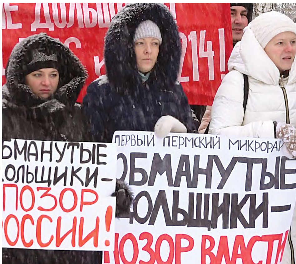
Брошенные на произвол судьбы люди, с навязанными непомерными долгами и отсутствием обещанного жилья, — действительно, позор власти