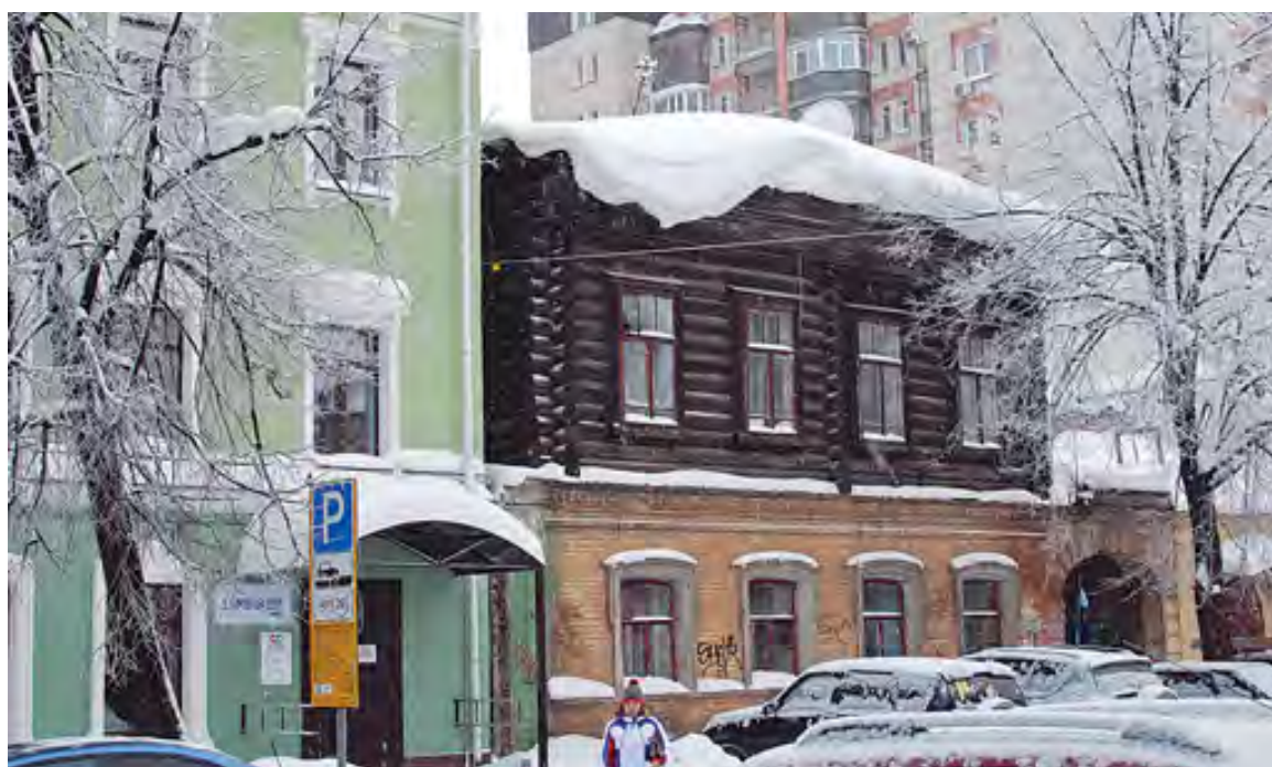
Эта снежная шапка висит еще с прошлого года (ул. Пермская)

В первые дни нового года в Перми выпала почти месячная норма осадков. Как справились с этим подрядчики?