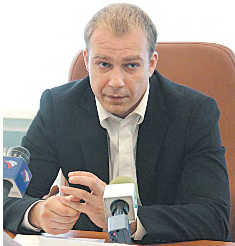
УФАС усмотрело в действиях «Автовокзала» признаки навязывания услуг

Без прозрачной структуры ценообразования сложно судить, сколько на самом деле средств «Автовокзал» тратит на выполнение своих обязательств. Введение градации по количеству проданных билетов лишь показывает, что цифры могут быть взяты с потолка.