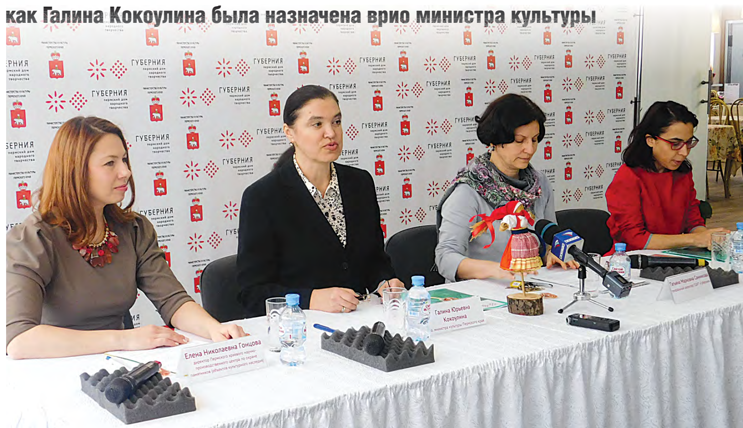
Встречи с прессой министерство культуры будет проводить регулярно

Темой пресс-конференции стали несколько событий: открытие выставочной ярмарки народных промыслов, празднование Масленицы, фестиваль Дениса МАЦУЕВА, а также появление новых проектов взамен старых.