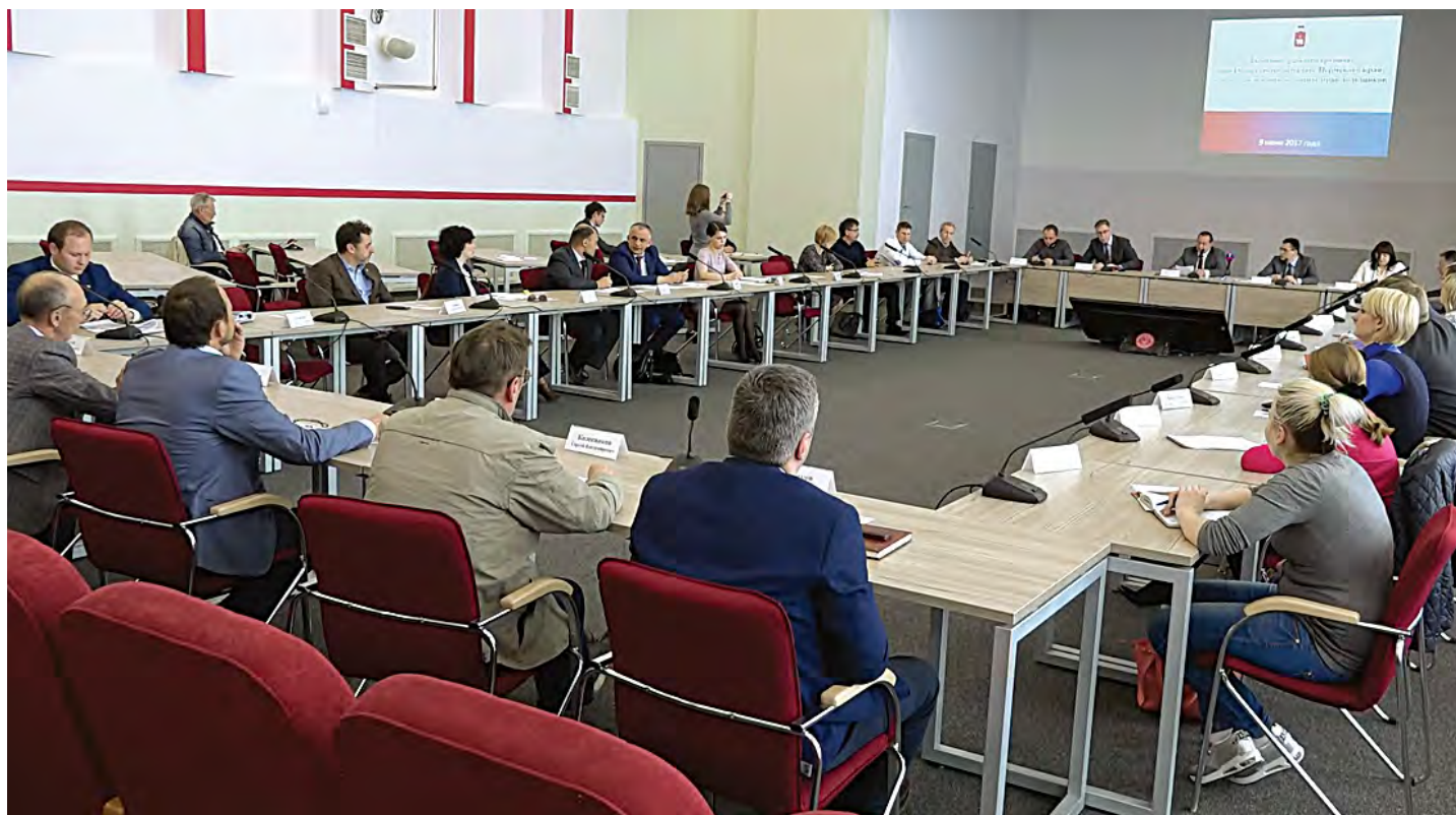
Минстрой Пермского края представил обманутым дольщикам свой план решения проблемы

В этом году на уровне правительства края принято решение предоставить участникам долевого строительства компенсацию на достройку домов — поряд-