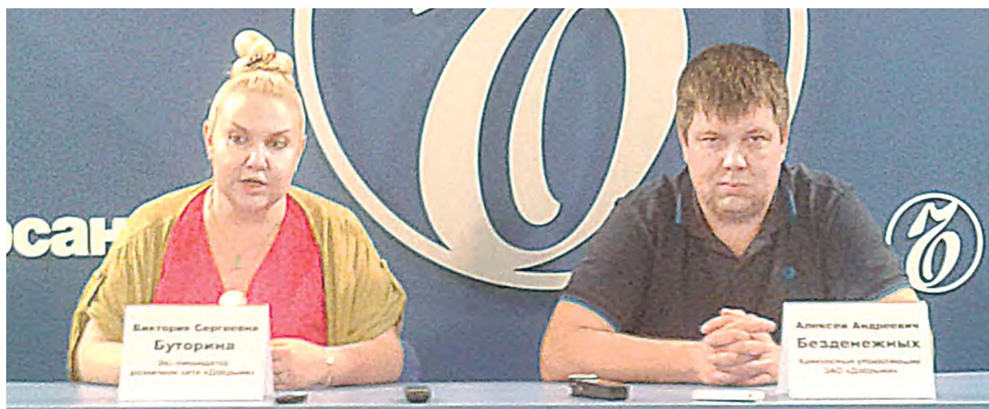
Ликвидаторы ЗАО «Добрыня» рассказали о своих мытарствах в арбитраже

Отметим также, что из-за того что судебные приставы заблокировали счет компании, многие сотрудницы не могли