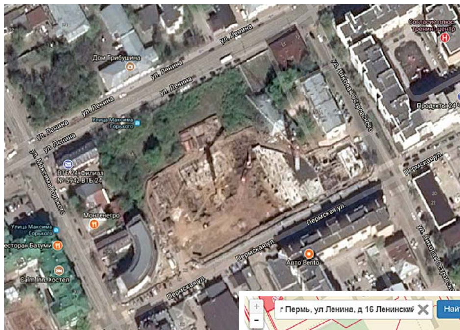
Спутниковая съемка участка под поликлинику

Особенно остро вопрос встал в декабре прошлого года, когда закрыли сразу две поликлиники: на ул. Пермской, 45 и Советской, 24.