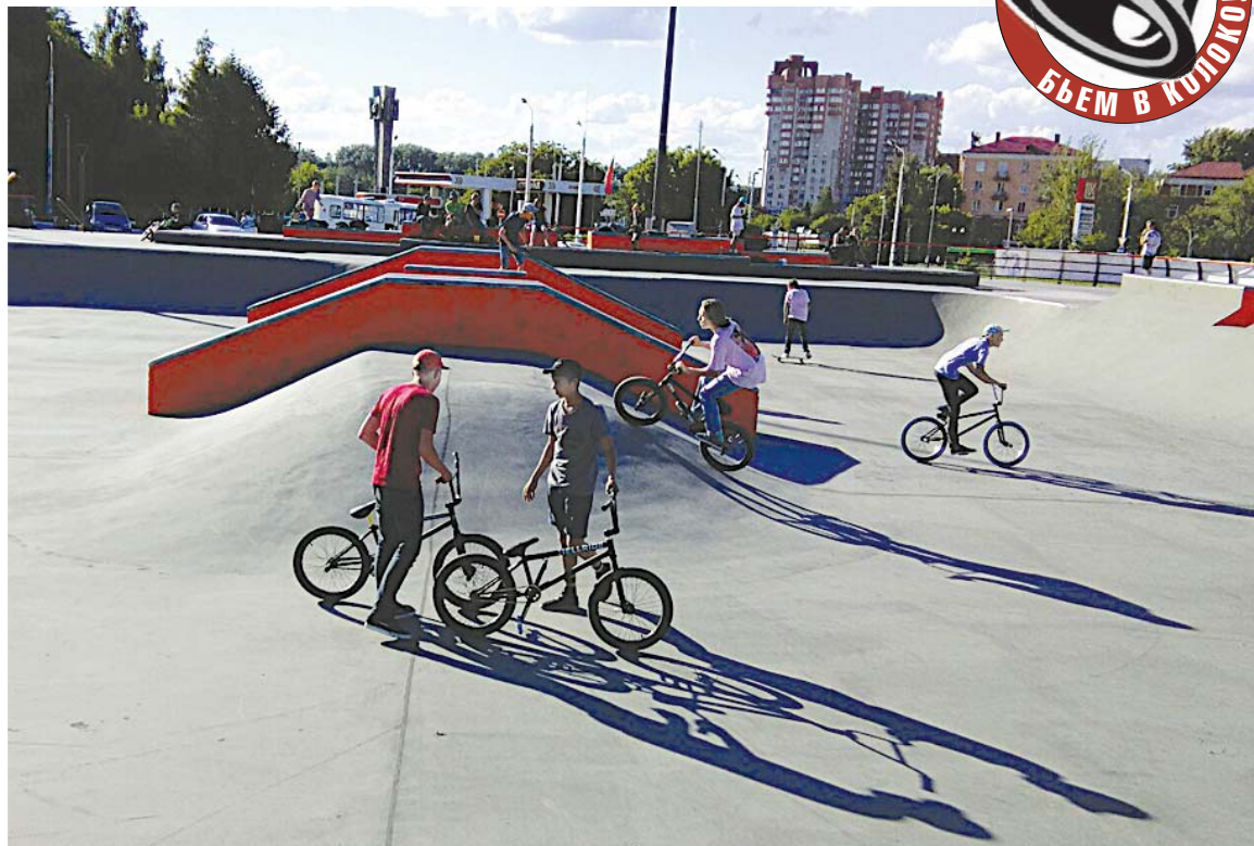
Скейтбординг — уже олимпийский вид спорта... но только не для Перми