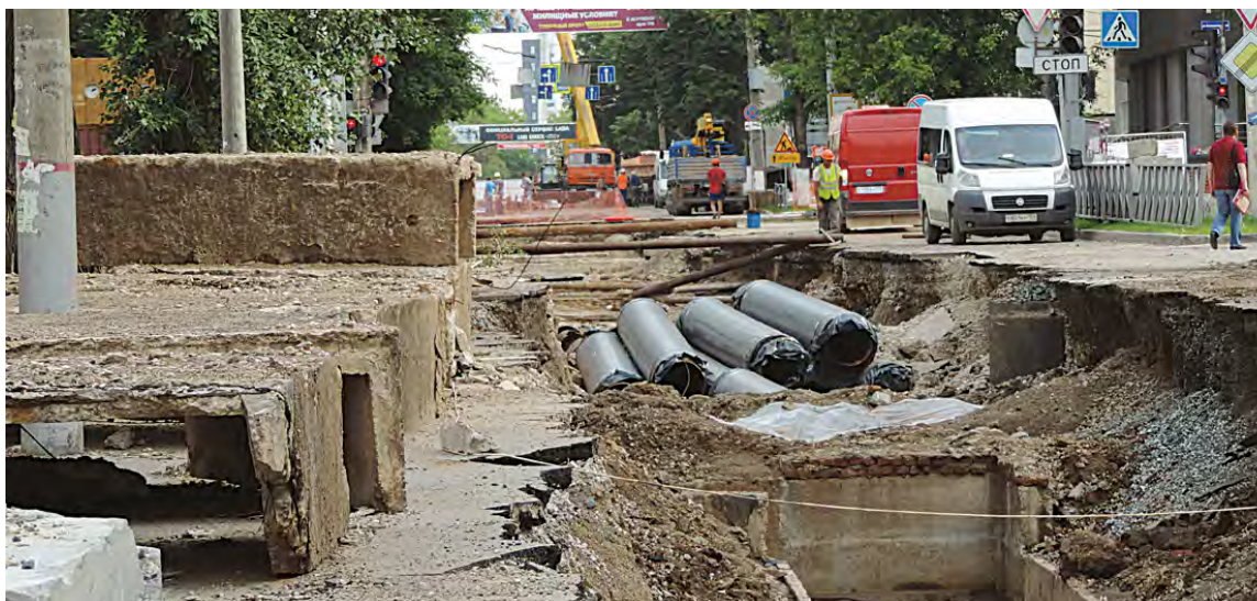
Департамент ЖКХ администрации Перми ежедневно контролирует работы по подготовке к отопительному сезону

В отношении 3489 многоквартирных домов уже сданы паспорта готовности, что составляет более 56% от их общего числа в Перми.